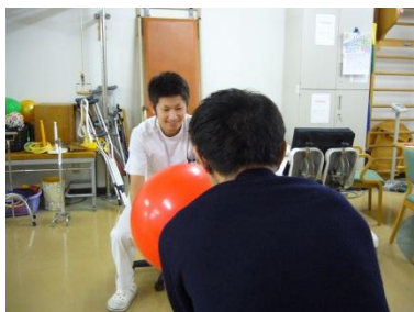
(ボール投げを利用したの座位練習)