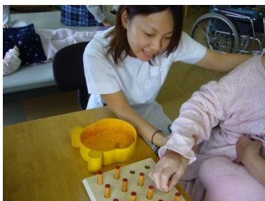
(細かい指先の動作練習)